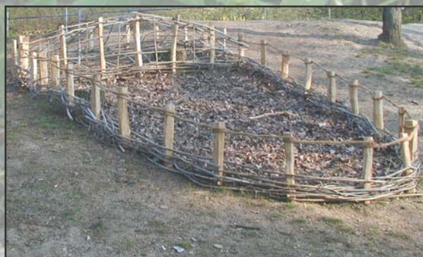
photo : place de jeux, Le Mail, Neuchâtel