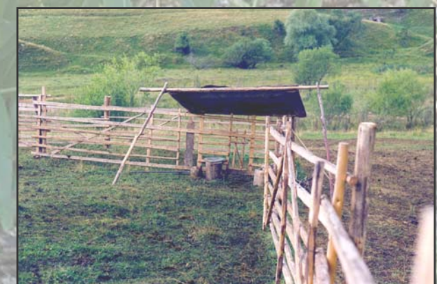
photo : barrière en Roumanie