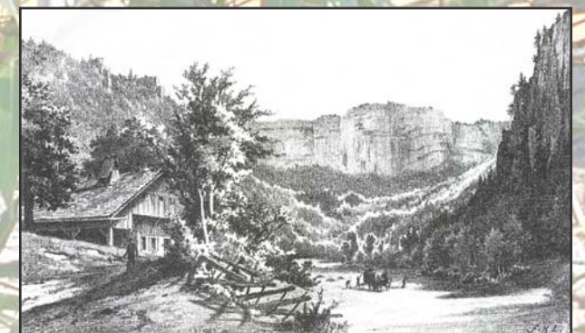
source : Une approche géographique, historique, littéraire et anecdotique de la région du Creux du Van Editions du Club Jurassien